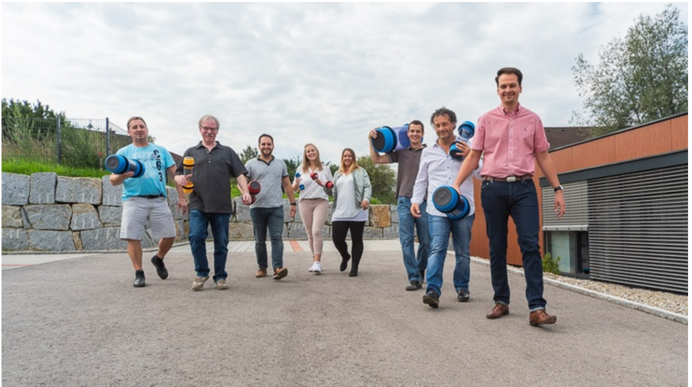
Einige Mitarbeiter des Thalmayr-Teams präsentieren einen Auszug aus dem Rohrpostbüchsenportfolio